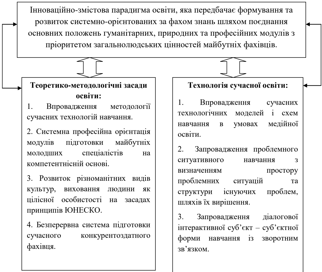
Рисунок 1 – Структура та зміст розвитку Лисичанського промислово-технологічного коледжу в цілому та зокрема підготовки фахівців за освітньо-професійною програмою «Організація виробництва» зі спеціальності 073 «Менеджмент» галузі знань 07 «Управління та адміністрування»

Вони забезпечують істотний синергійний вплив на очікувані результати діяльності майбутніх фахівців у відповідності з метою стратегії (рисунок 2).